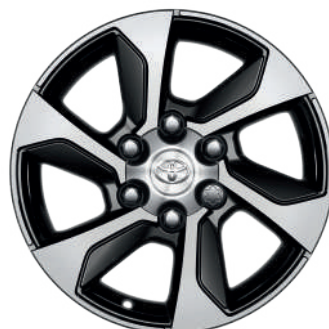
Колісні диски R18