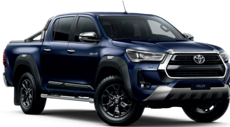
Декоративна накладка переднього бампера, сірого кольору