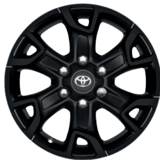
Колісні диски R17