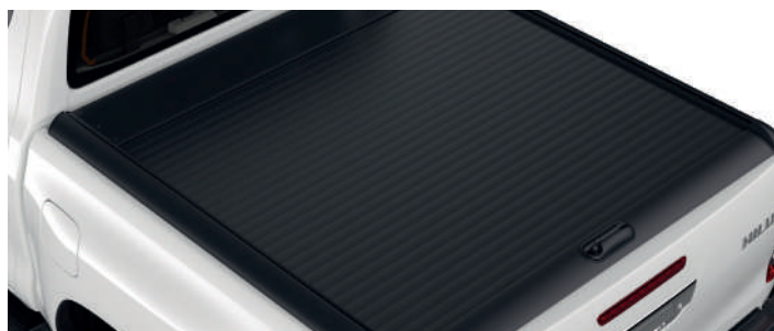
Кришка вантажної платформи