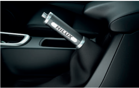
Шкіряний чохол ручки ручного гальма