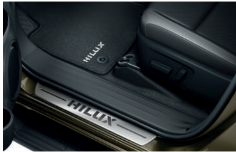
Накладки дверних порогів, килимки гумові