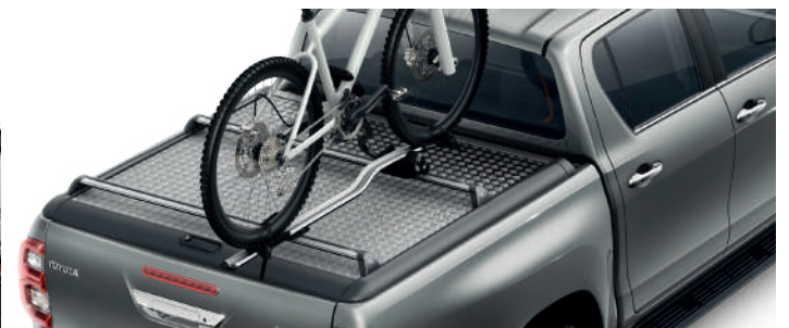
Кріплення для перевезення велосипеда на даху