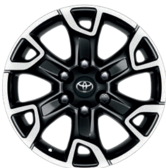
Колісні диски R17