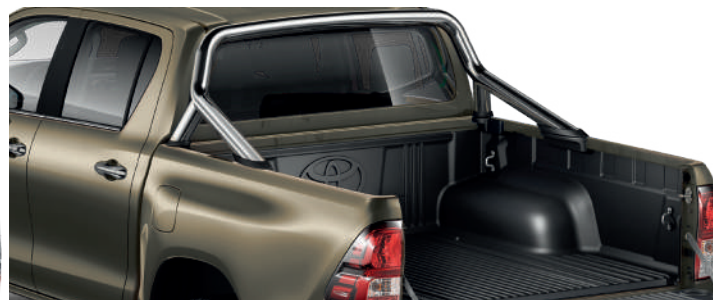
Дуга вантажної платформи