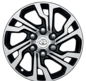
Колісні диски R18